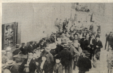
... Le 14 juillet était une occasion de fêter la prise de la Bastille, par la prise de pas mal de canons de gros calibre pour faire passer le pain et l'andouille offerts par la municipalité.

Madame Blanche CACHEUX (Journal des Sans Soucis)