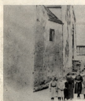
1897, école installée avec la mairie près de l'église

Une première indication en 1831, donne 50 F pour l'instituteur et 40 F pour le logement.