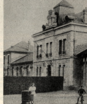
La mairie et les écoles

En 1849, sur plainte des habitants qui demandent pourquoi l'Angelus n'est plus sonné le matin, Monsieur le Maire répond