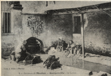
... Les langues marchaient aussi vite que les battoirs ! 9 - Evénements de Meulan - Gargenville - Le Lavoir

À la fin du siècle dernier, je suis né à Gargenville, c'était à cette époque un village campagnard de quelques 650 habitants (699 au dernier recensement avant la guerre de 1914). Ces habitants se composaient de beaucoup de petits agriculteurs, 17 rien que pour Gargenville, 8 à Hanneucourt, et 4 à Rangiport, sans compter la ferme du Clos de Brayon qui était déjà ce qu'elle est aujourd'hui et la ferme de Montillet disparue par l'implantation de la raffinerie.