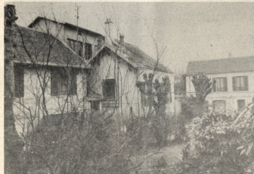
Les Maisonnets d'Hanneucourt

Professeur à l'École normale de musique et au Conservatoire américain de Fontainebleau de 1920 à 1939, la déclaration de guerre le trouve aux Etats-Unis où elle restera pendant la durée de celle-ci, y formant de nombreux élèves