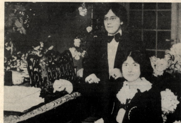
Lili et Nadia Boulanger

Devant le génie de sa jeune sœur dont elle surveille et conduit les études musicales avec vigilance, Nadia Boulanger renonce à une carrière de compositeur qui s'avérait pleine de promesses, se tourne vers l'interprétation, la direction d'orchestre (elle sera la première femme à diriger les orchestres de Boston et de New York), et s'engage dans sa vraie vocation : l'enseignement.