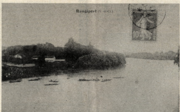
... Il y avait une course en barque, contre un canard sauvage qui donnait du fil à retordre aux concurrents car il se fauillait sous les barques...